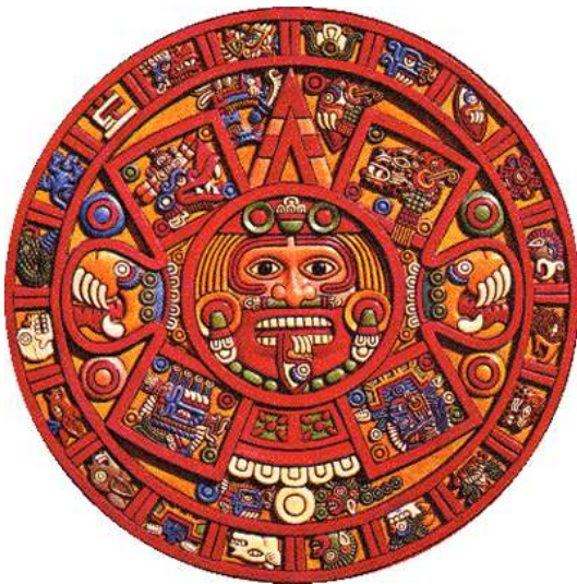
KALENDÁŘ DNEŠNÍ DOBY

Tento kalendář byl údajně dárek mimozemských Mayů.