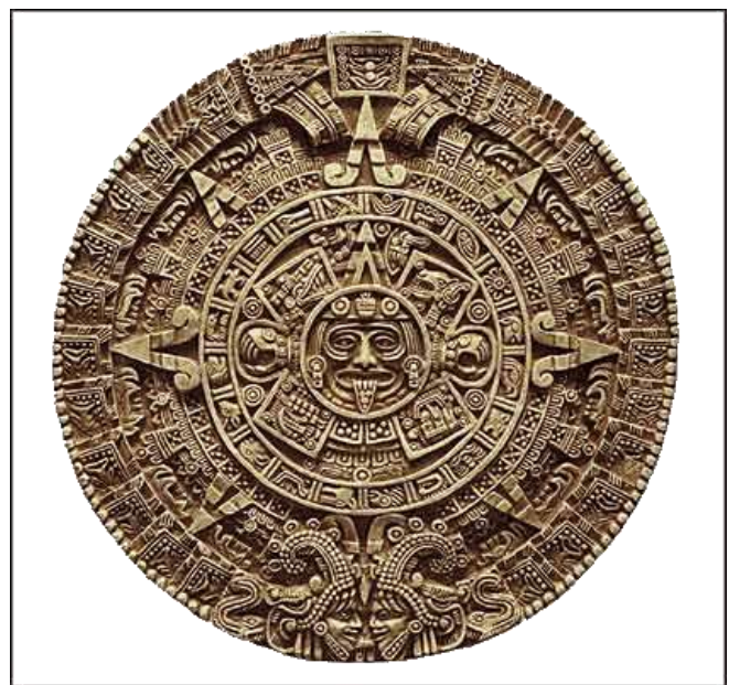
HISTORICKÝ KALENDÁŘ PRAVÝCH MAYJŮ